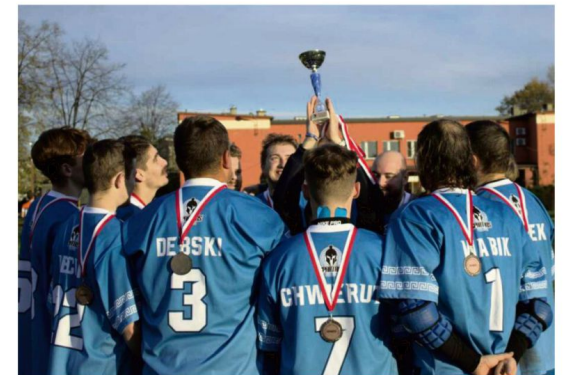
Na stadionie Iskry w Brzezince zakończyły się rozgrywki Pucharu Polskiej Federacji Lacrosse 2023 ligi szóstek. Brązowy medal wywalczyli Spartanie z Oświęcimia.

Puchar Polskiej Federacji Lacrosse 2023 ligi szóstek zdobyła pierwsza drużyna wrocławskich Kosynierów (42 pkt). Srebro przypadło katowickiemu Legionowi (33 pkt), a po brązowe medale sięgnęli oświęcimianie (21 pkt), którzy lepszym bilansem bezpośrednich spotkań wyprzedzili Królów z Krakowa (21 pkt).