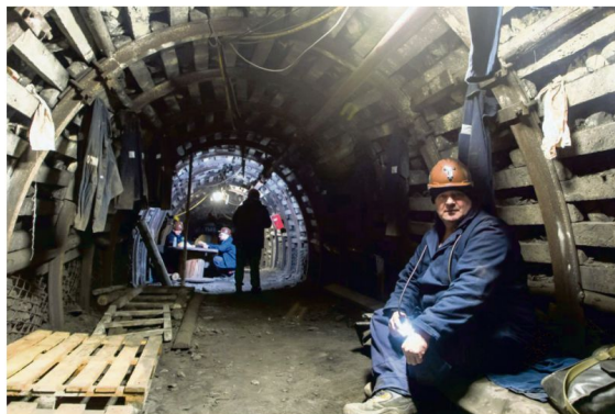
Rekonstrukcja strajku w KWK „Piaść” przygotowana w Kopalni Guido w 40. rocznicę wydarzeń.

Lech Chodacki, współpraca: Karolina Gawel