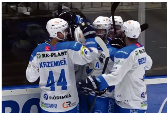
Kup bilet i wspieraj oświęcimską Re-Plast Unii w finałowym turnieju o Puchar Polski w Krynicy.

Aż dziewięciokrotnie Puchar Polski zdobyli tyszanie. Czterokrotnie naj-