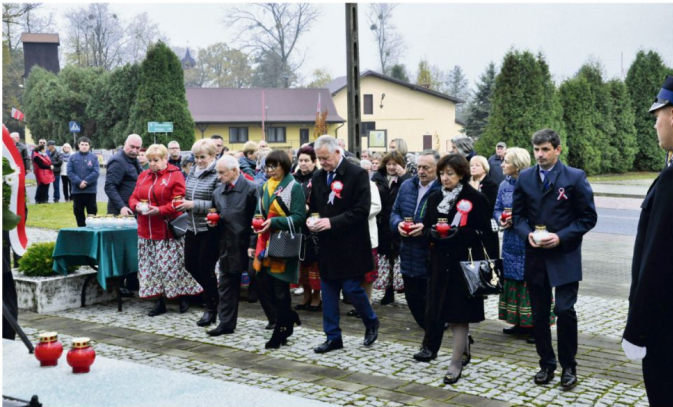
11 listopada, Poręba Wielka.

11 listopada w Oświęcimiu po nabożeństwie w kościele Salezjanów świętujący mieszkańcy przemarszerowali biało-czerwonym pochodem przez Rynek na Plac Kościuszki.