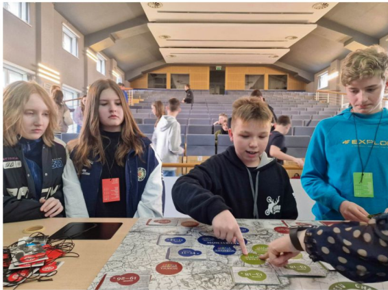
Uczniowie szkoły w Grojcu na zajęciach w Małopolskiej Uczelni Państwowej w Oświęcimiu.

Ważnym punktem ekonomicznych rozważań była wycieczka klas trzecich i szóstych na Małopolską Uczelnię Państwową im. rtm. Witolda Pileckiego