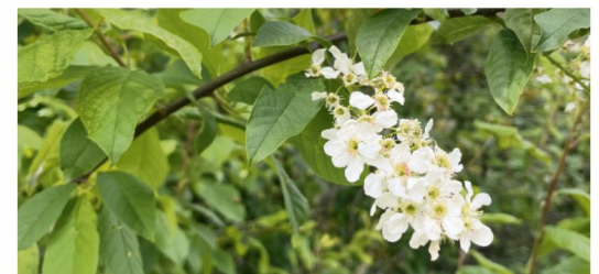
Czerecha zwyczajna.