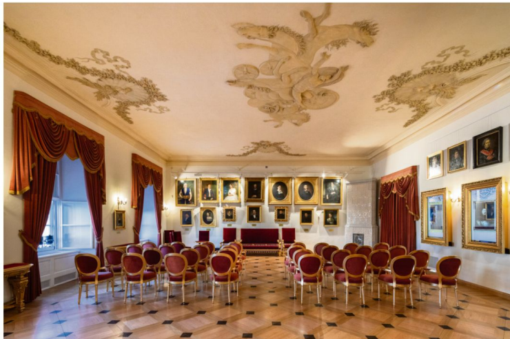
Widok ogólny sali Fontany.

Dzięki przeprowadzonemu remontowi, stworzono nowoczesne przestrzenie wystawiennicze.