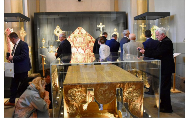
Wystawa MuRo w kościele w Polance Wielkiej. Fot. WS

MuRo składa się z trzech części. Zasadniczy moduł stanowi pięć drewnianych, zabytkowych budynków – kościoły w Grojcu, Nidku, Osieku i w Polance Wielkiej oraz budynek dawnej szkoły w