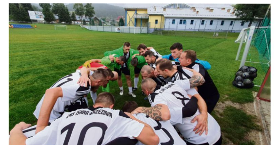
Piłkarze Iskry Brzezińska będą chcieli "postraszyć" ekipę lidera z Malca, ale szanse na mistrzostwo mają już tylko matematyczne.

Drużyna konsekwentnie realizowała przedmeczowe założenia. Jesteśmy coraz dżejrali na boisku i idziemy we właściwym kierunku - dodaje grający trener, który w meczu ze Strumieniem podobnie jak Oskar Kyrz nabawił się kontuzji.