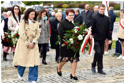
8 maja, Poręba Wielka, hołd ofiarom II wojny światowej składa delegacja sołectwa.