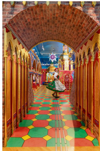
We wnętrzu szopki.

dawnych przemałowań wydobyto bogate freski, które cieszą oczy zwiedzających. W najbardziej reprezentacyjnej sali pałacu, zwanej Salą